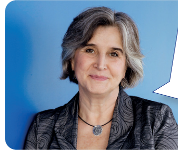
Maria Noichl, MdB Spitzenkandidatin maria-noichl.eu

Das große Problem unserer Landwirtschaft ist nicht der Agrardiesel und auch nicht die Ampel, sondern der Teufelskreis zwischen einem unkontrollierten Bodenmarkt , einer schwachen Position der Landwirt:innen am Markt, Dumpingpreisen , die dauerhaft zu einer Produktion unter Einstandspreis führen, landwirtschaftsfeindlichem Freihandel und als Dreingabe einem veraltetem, europäischen Subventionssystem, das kleine und mittlere Betriebe benachteiligt.