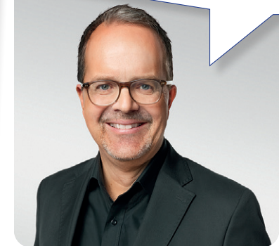
Markus Rinderspacher, MdL Vizepräsident des Bayerischen Landtags, Europapolitischer Sprecher der BayernSPD-Landtagsfraktion

Am 9. Juni treten Parteien zur Wahl an, die Europa abschaffen wollen. Durchkreuzen Sie deren Pläne! Stimmen Sie für Stabilität und Zukunft, damit auch die nächsten Generationen in einem geeinten und freien Europa leben können. Geben Sie Ihre Stimme der SPD.